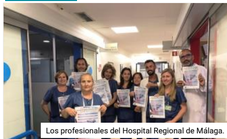
Los profesionales del Hospital Regional de Málaga.