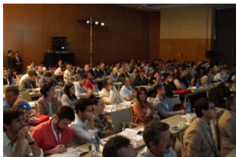
Imagen de una de las comunicaciones del congreso.

La cirugía maxilofacial es la única solución real para resolver la apnea del sueño, una enfermedad que afecta al 5% de los españoles –un 30% de los mayores de 50 años– y que está infradiagnosticada. Sobre este y otros temas debaten estos días en Málaga, en concreto entre el jueves y hoy sábado, numerosos expertos maxilofaciales en el marco del Congreso Nacional de Cirugía Oral y Maxilofacial.